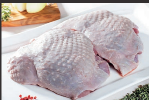
Udziec indyczy ze skórą, bez kości