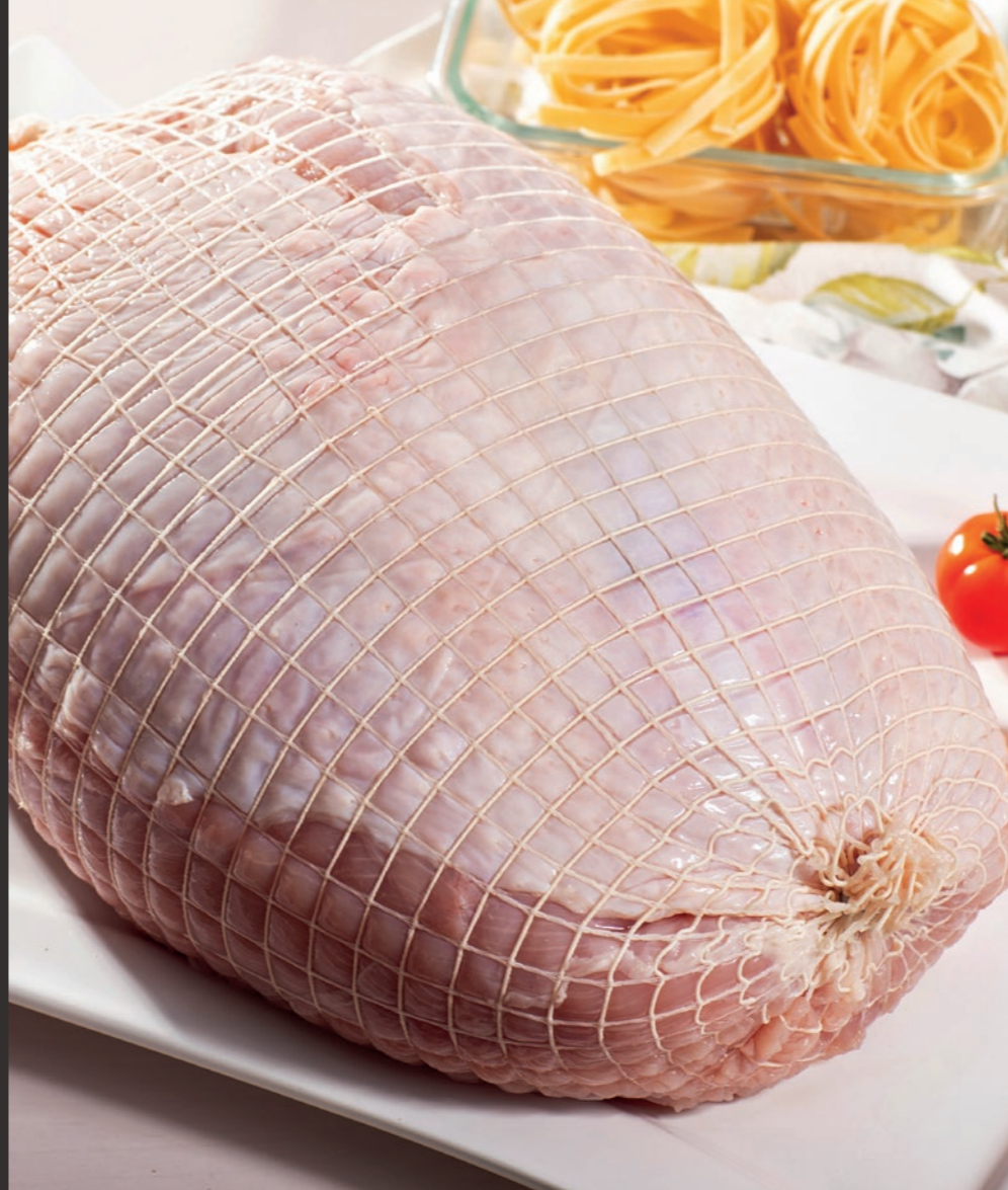
Filet indyczy podwójny ze skórą, w siatce