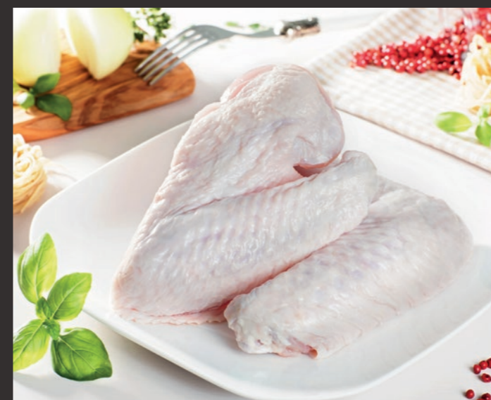
Skrzydło indycze dwuczęściowe