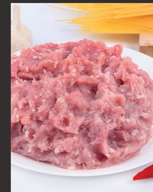
Mięso indycze z fileta 3 mm