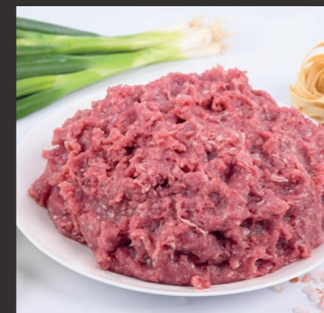
Mięso indycze z podudzia 3mm