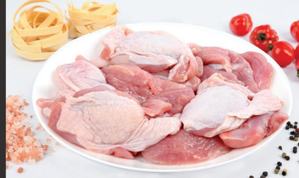
Mięso indycze ze skrzydła, ze skórą, bez kości