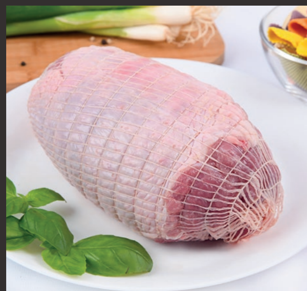
Udziec indyczy ze skórą, bez kości, w siatce