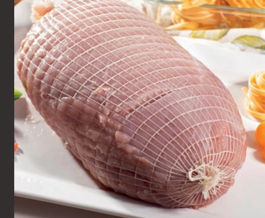
Filet indyczy bez skóry, w siatce