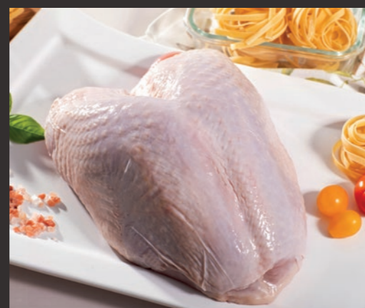
Filet indycki ze skórą, z kością