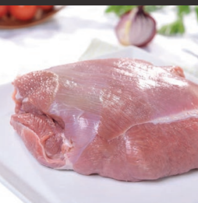
Udziec indyczy bez skóry, bez kości