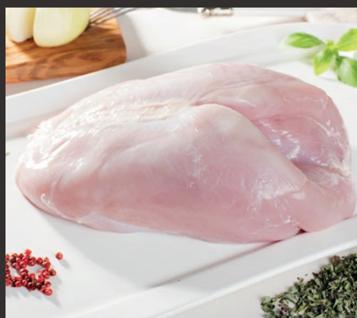
Filet indycki podwójny bez skóry