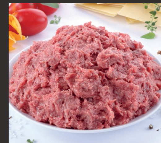
Mięso odkostnione mechanicznie 1 mm