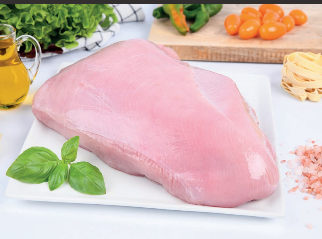
Filet indycki bez skóry