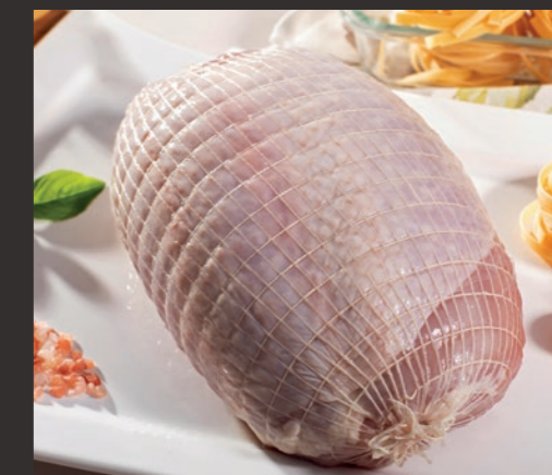
Filet indyczy ze skórą, w siatce