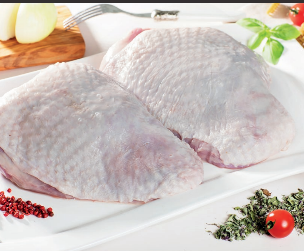
Udziec indyczy ze skórą, z kością