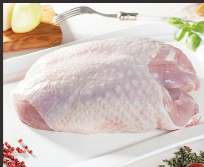
Filet indycki podwójny ze skórą