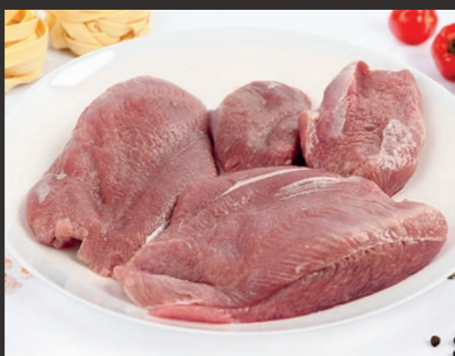
Steki z nogi indyczej