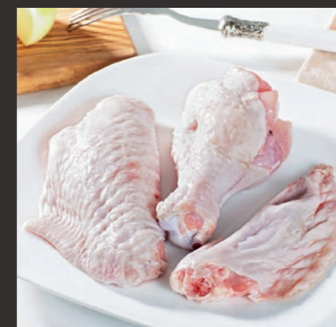
Skrzydło indycze środkowe/pierwsza część/lotka